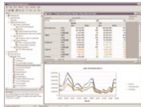
MarketingTracker Outliner en Dataviews