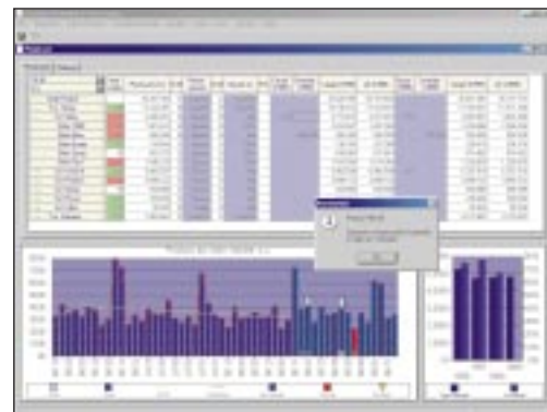
PlanCaster Sales Planning Module